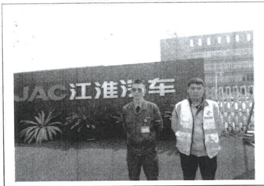
现场监测人员与企业陪同人员留影